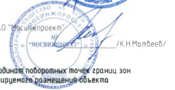
Каталог координат поворотных точек границ зон планируемого размещения объекта