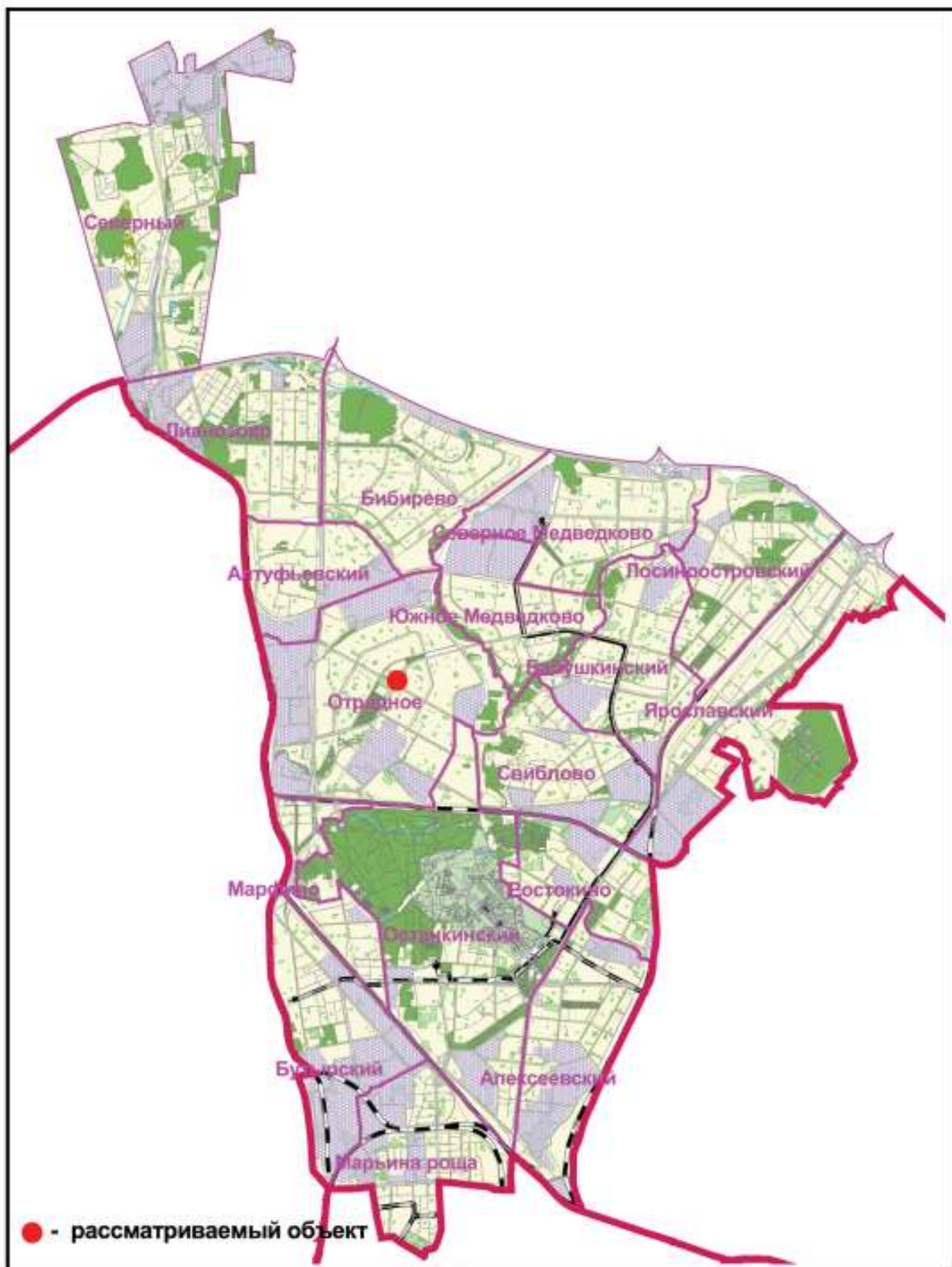
СХЕМА РАЗМЕЩЕНИЯ ОБЪЕКТА НА ТЕРРИТОРИИ СЕВЕРО-ВОСТОЧНОГО АДМИНИСТРАТИВНОГО ОКРУГА